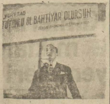
Dünkü toplantıdan bir intiba

Tasarruf ve Yerli Mallar Haftası münasebetile yapılan toplantıda mekteb müdürü, profesörler ve talebeler bu mevzu etrafında konuşular