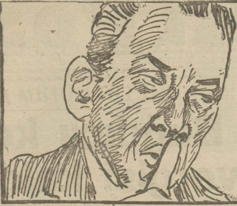
İyi konuşmak elde edilmesi epeyce güç, zamana bağlı bir san'attir.