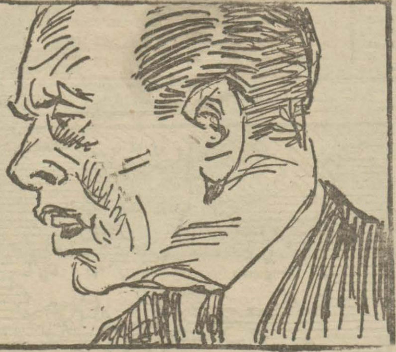
Zamanında susmayı bilmek ise güç san'atların da başında gelen bir ka-biliyettir.